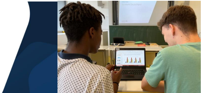
Statista in Aktion: Schüler der Klassenstufe 11 bei der Analyse des Biomarktes im Wirtschaftsleistungskurs.

Statista ist über unser Schulnetzwerk für alle Lehrkräfte sowie alle Schülerinnen und Schüler erreichbar und kann individuell für den Unterricht, aber auch für eine GFS eingesetzt werden.